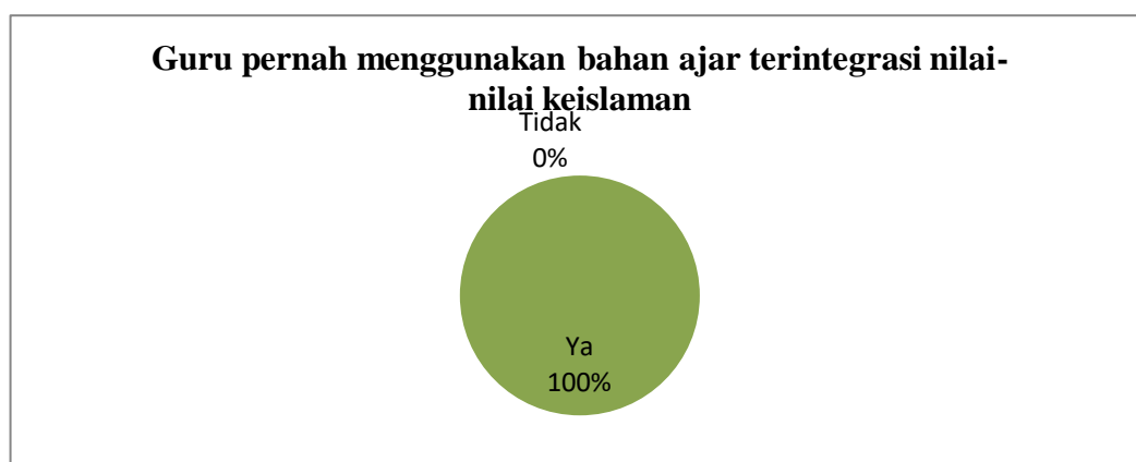
Gambar 2. Hasil Angket Peserta Didik Diolah Dengan Ms. Excel

Kegiatan selanjutnya adalah menganalisis lingkungan tempat pembelajaran dilakukan dengan tujuan untuk mengetahui situasi di mana pembelajaran berlangsung. Menurut analisa yang dilakukan peneliti, lingkungan MIS Al Falah adalah sekolah di bawah naungan Kementerian Agama yang memadukan pembelajaran agama Islam dan pembelajaran akademik, namun gurunya tetap mengajar sesuai buku yang tersedia dan menghubungkan ilmu dari sudut pandang agama. Informasi tersebut diperoleh dari hasil angket siswa berikut ini