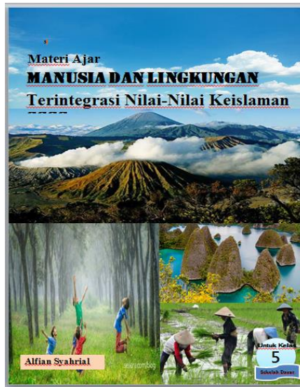
Gambar 4. Tampilan Sampul

Halaman sampul merupakan elemen penting dalam penyajian materi pendidikan ini karena menciptakan kesan pertama pembacanya. Sampulnya didominasi warna biru, hijau, dan putih. Ada foto orang dan lingkungannya. Ada juga kelas dan nama penulisnya. Berikut gambar sampul depan: